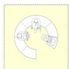
5 plekken - laag